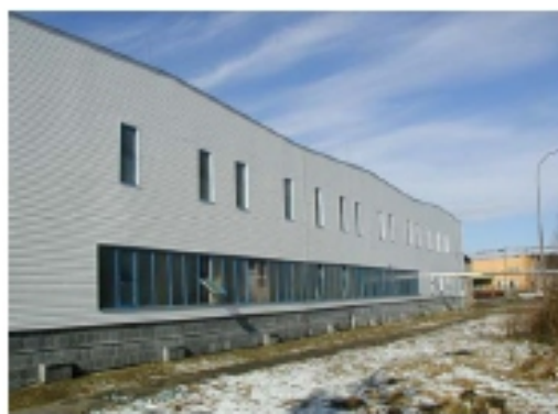
Finalizácia fasádnym obkladom Vinyl siding

Pred inštaláciouí dosiek HFD môžu byť do vodorovne položených kaziet natiahnuté šnúry.