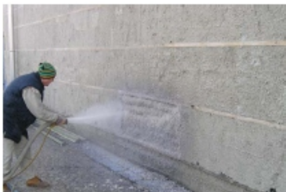
Aplikácia Climatizeru nástrekom