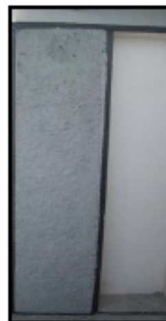
Sadrokartón 12,5 mm

Aby bolo u oddelených trámikov zaručené homogénne naplnenie konštrukcie, je možné medzi trámiky nasponkovať pásy zo sadrokartónu alebo z dosiek HFD. Takto vzniknuté jednotlivé priestory sa potom plnia zvlášť. Alternatívne môže spracovateľ pracovať so špeciálnou koncovkou X jet, aby sa minimalizovala prachová záťaž obytných priestorov. Proti úniku izolácie pri prípadných úpravách sa môže pod opláštenie napnúť izolačný papier. Ak stena hraničí s nevypukovanou miestnosťou, potom má špeciálny papier na teplej strane konštrukcie tiež parozbrzdny účinok a musí vykazovať zvýšenú hodnotu sd (previesť výpočet difúzie pár podľa ČSN EN ISO 13788)